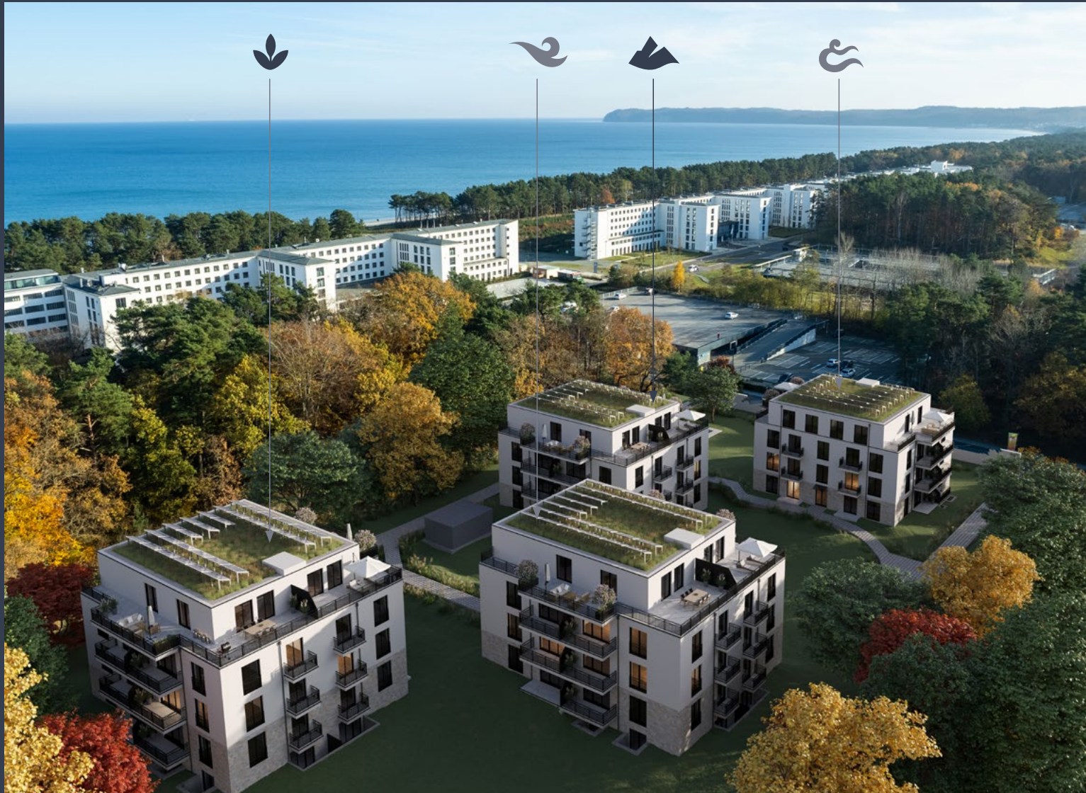
Abbildung aus Sicht des Illustrators